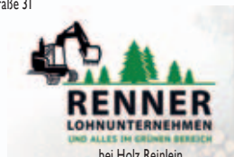
bei Holz Reinlein