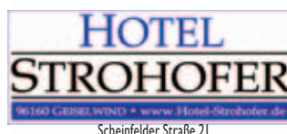
Scheinfelder Straße 21