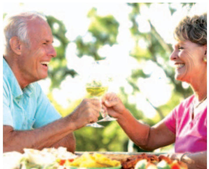
Totalprothesen können komplett durch fest sitzende Zähne ersetzt werden. Damit kann man nicht nur wieder alles essen, was einem schmeckt. Man gewinnt auch deutlich mehr Lebensqualität und Sicherheit.

sprechen. Manche älteren Patienten fragen sich auch, „ob sich das noch für sie lohnt.“ Das Problem ist, dass niemand die Frage beantworten kann, wie viele Jahre einem noch bleiben. Im Prinzip muss jeder für sich entscheiden, was ihm Lebensqualität und Gesundheit wert sind. Wer mit fest sitzenden Zähnen wieder normal essen und gut kauen kann und dadurch wieder eine bessere Verdauung hat, kann damit auch seine Gesundheit fördern. Implantate sind heutzutage eine bewährte und erprobte Behandlungs-Methode. Allerdings erfordert sie besondere Erfahrung und Sorgfalt von Seiten des Zahnarztes. Wichtig ist auch eine individuelle und ausführliche Beratung des Patienten vor der Behandlung. Quelle: Zahnarzt Jens Heukelbach