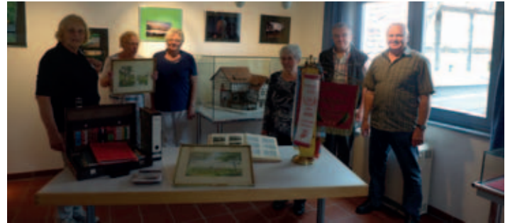
Auf dem Bild sind von links nach rechts zu sehen:

Maskenbälle, Weihnachtsfeiern, Ausflüge ins umliegende Frankenland, Teilnahme an Vereinsjubiläen in Burghaslach, sowie als Höhepunkt, jährlich der Besuch der Hosler Kerwa.