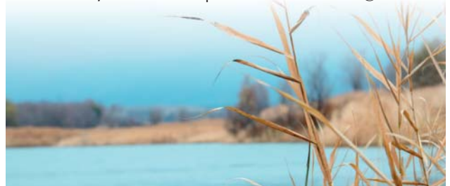
Bereiche Burghaslach, Geiselwind, Scheinfeld und Schlüsselfeld

Sie erreichen uns montags bis freitags von 9.00 Uhr bis 12.00 Uhr unter Tel.: 0 95 52 / 9 30 78 59 oder per eMail: daniel.lischewski@elkb.de