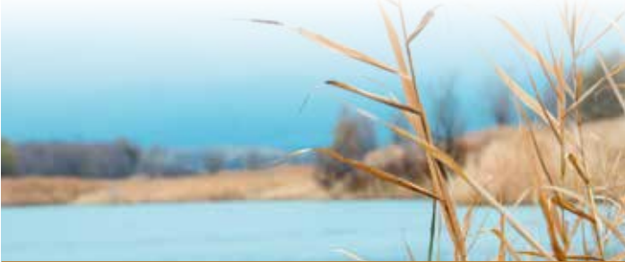
Bereiche Burghaslach, Geiselwind, Scheinfeld und Schlüsselfeld

Sie erreichen uns montags bis freitags von 9.00 Uhr bis 12.00 Uhr unter Tel.: 0 95 52 / 9 30 78 59 oder per eMail: daniel.lischewski@elkb.de