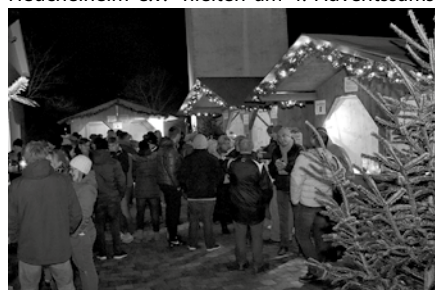
Die Gäste vor den weihnachtlich geschmückten Buden.

Die „Heuchlemer Kerwasburschen & -madli“ sowie die „Dorfgemeinschaft Heuchelheim e.V.“ hielten am 4. Adventssamstag den mittlerweile traditionellen Winterzauber ab. Trotz des durchwachsenen Wetters zog es zahlreiche Gäste nach Heuchelheim zum Dorfgemeinschaftshaus.