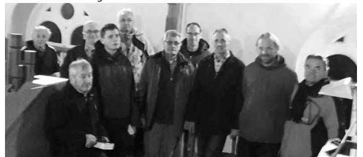
Der ökumenische Männertreff bei seiner adventlichen Zusammenkunft auf der Orgelempore der Kirche von Hohn am Berg.

Der ökumenische Männertreff hat auch im vergangenen Advent zu einer abendlichen Wanderung mit Andacht im Freien eingeladen. Aufgrund der nasskalten Witterung wurde kurzerhand die Andacht in die Kirche von Hohn