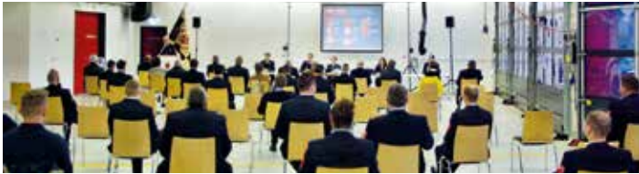
Jahreshauptversammlung in der Fahrzeughalle