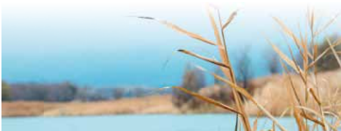
Bereiche Burghaslach, Geiselwind, Scheinfeld und Schlüsselfeld

Wir kooperieren seit Anfang 2019 mit dem Hospiz-Verein Neustadt a.d. Aisch e.V. Deshalb erreichen Sie uns in Zukunft unter der Tel.-Nr.: (0 91 61) 6 29 09 oder per Mail unter: info@hospiz-nea.de