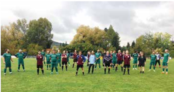
Die Spieler der Lauffer Mühle (in grün) und der Mannschaft aus Pretzfeld beim Gruppenfoto